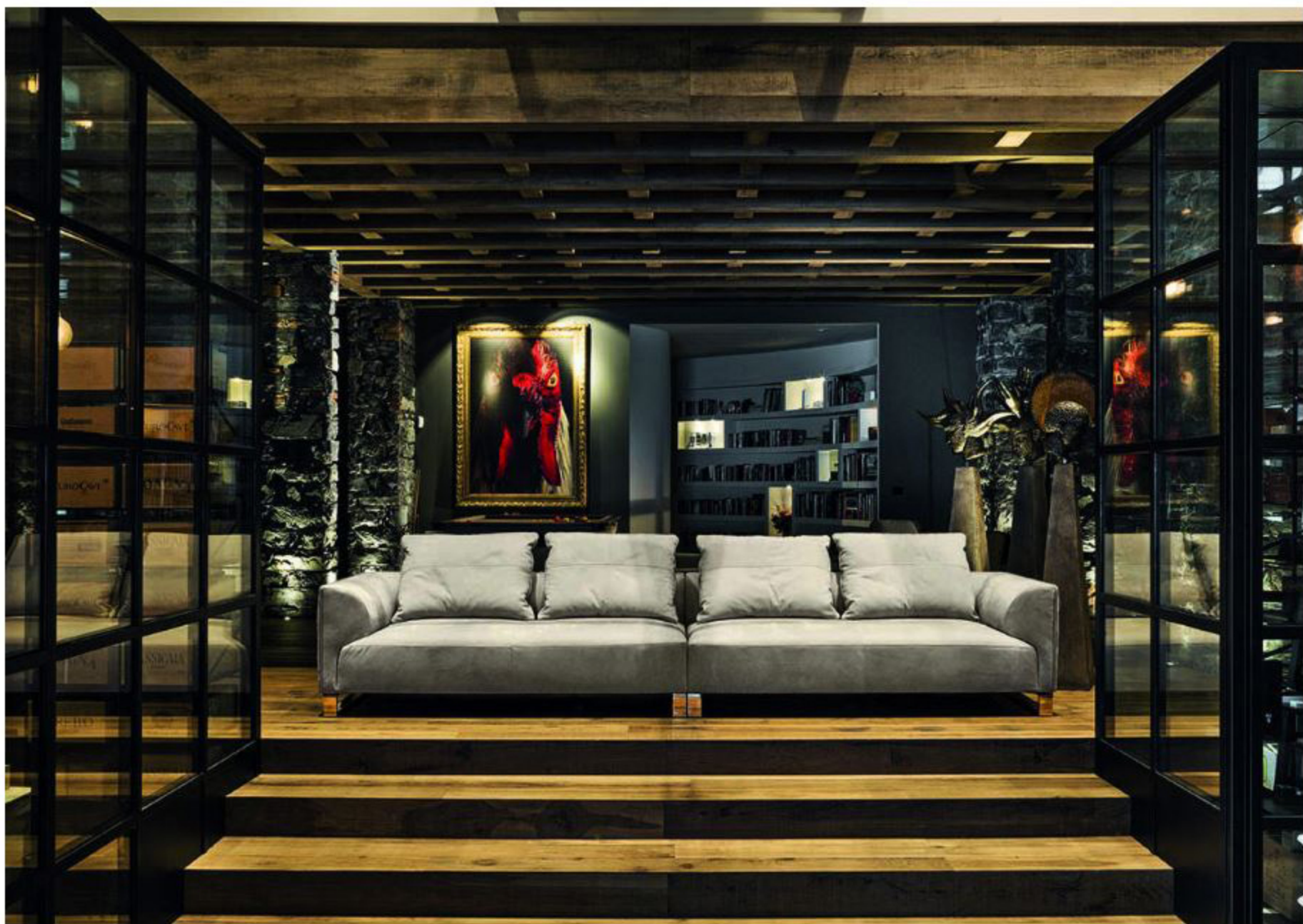
Стенд Longhi, диван Fold