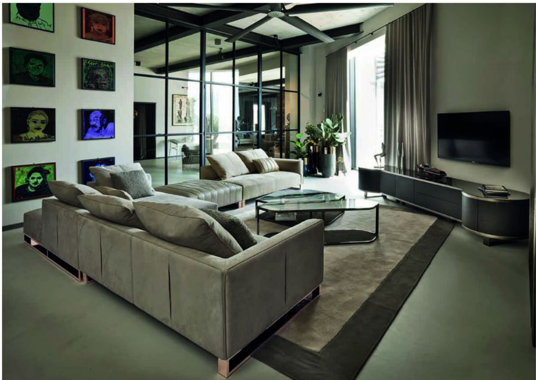
Диван Fold, Longhi