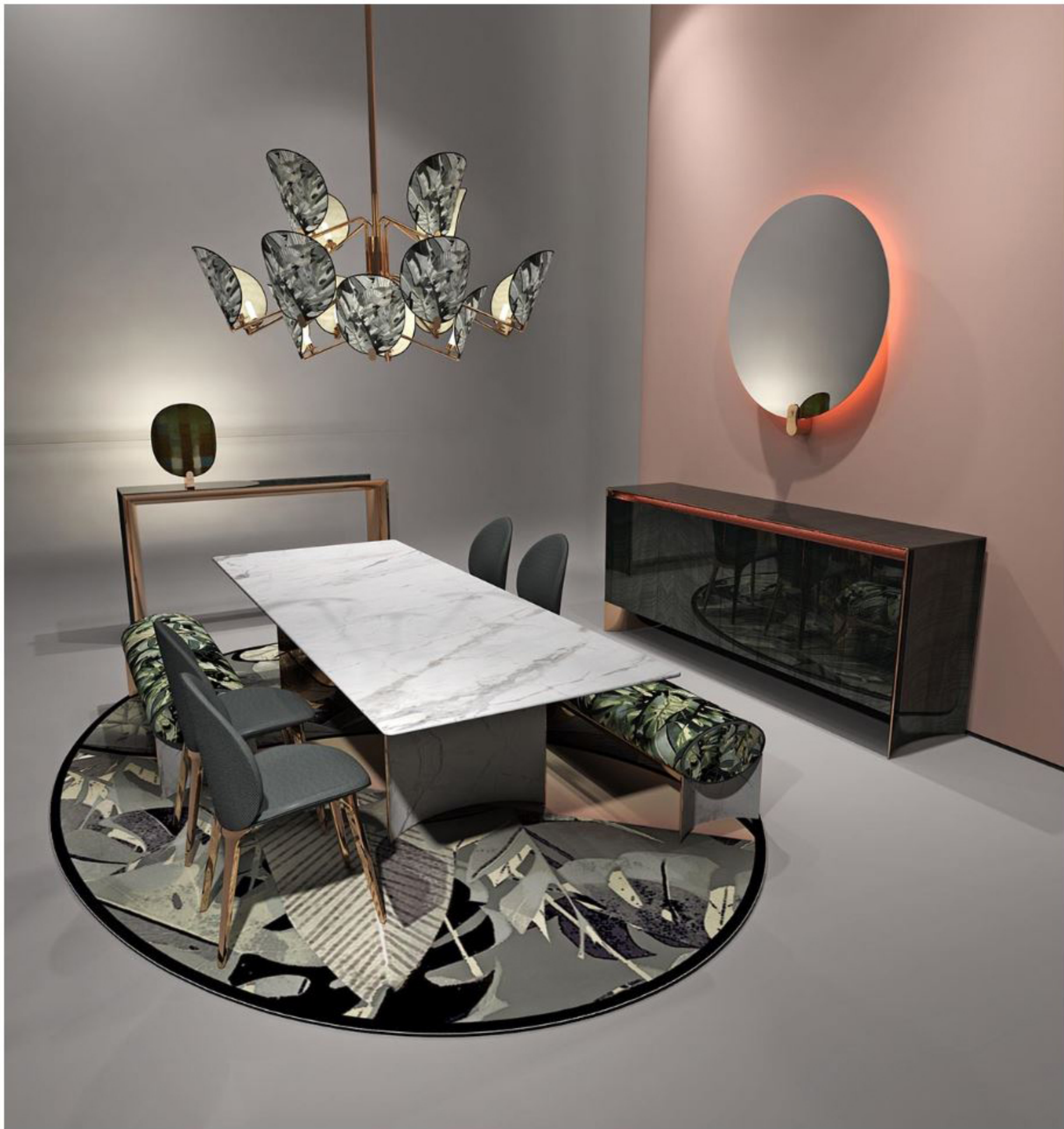
Обеденная зона, Respiro , Visionnaire