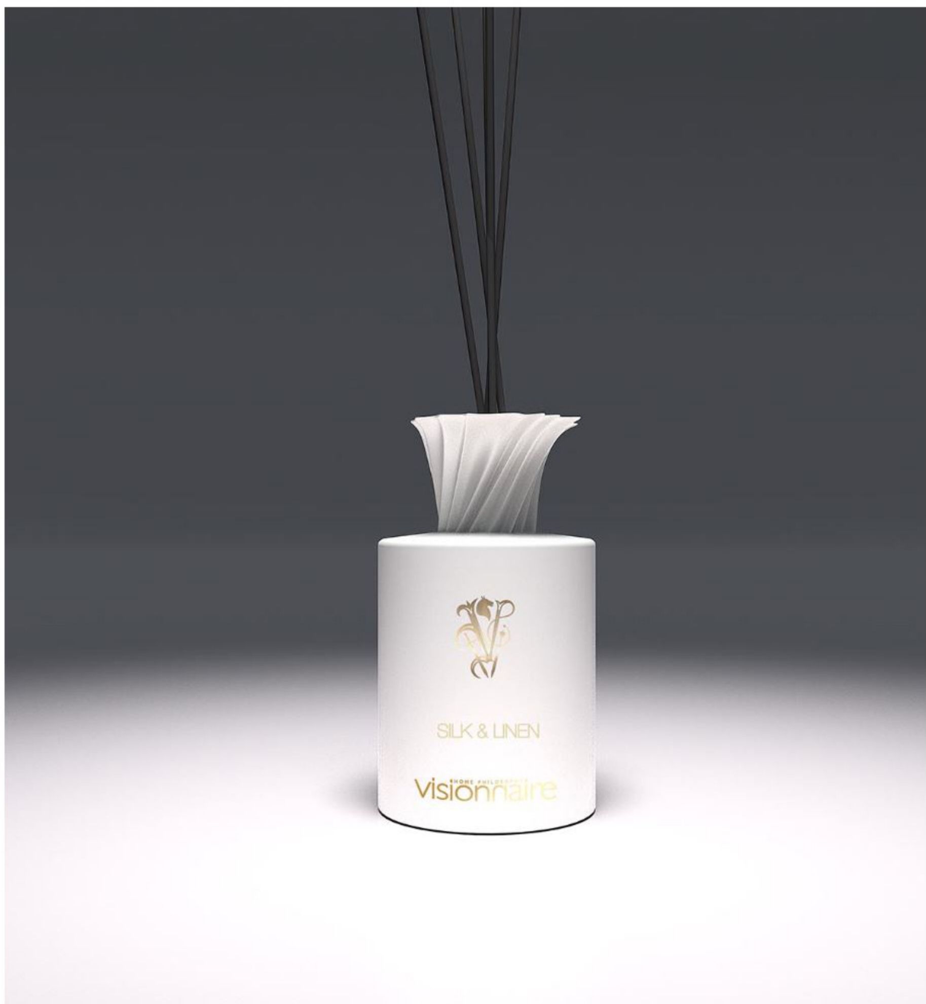
Baza Profumatore, Visionnaire