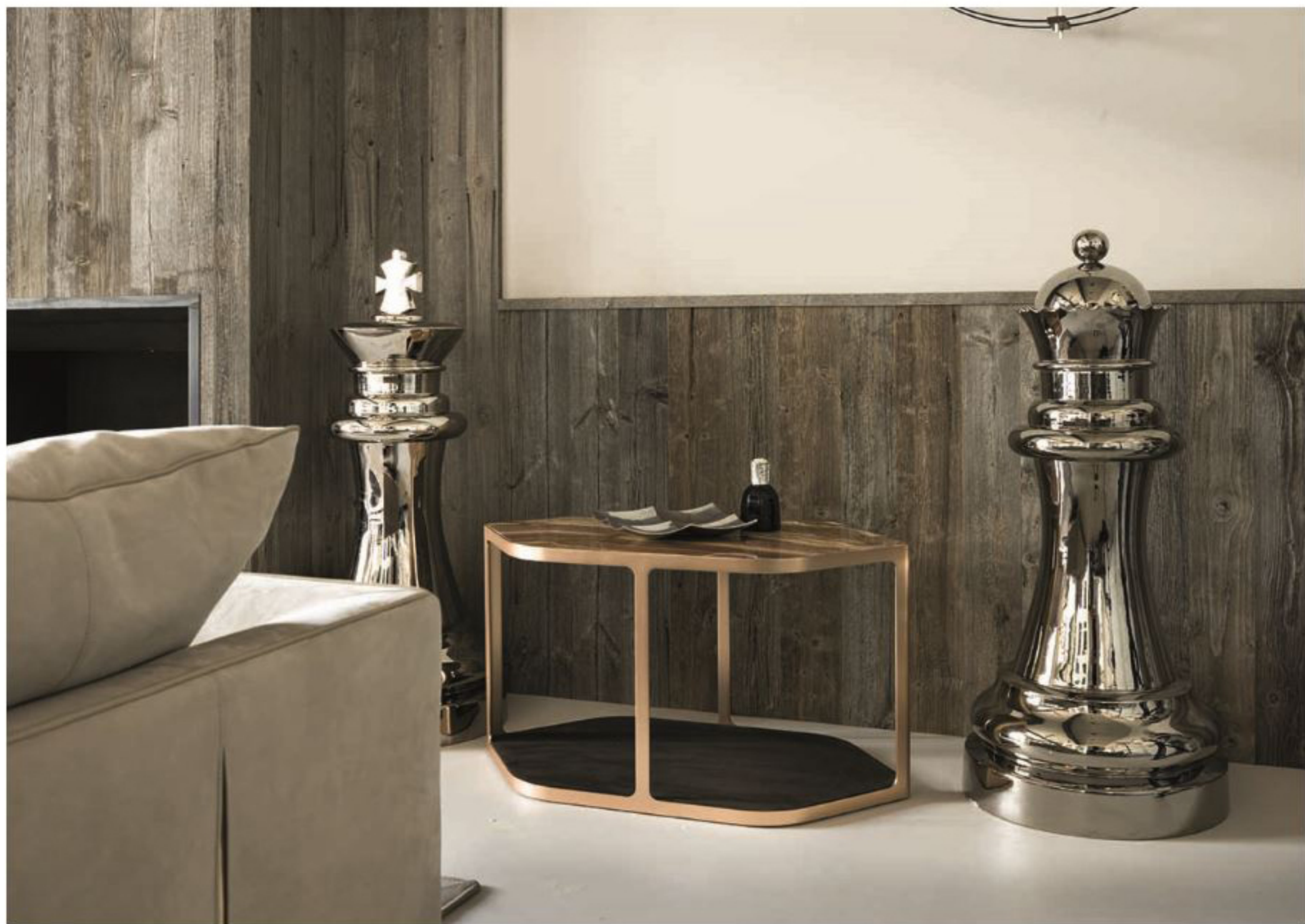
Стол Tiles, Longhi