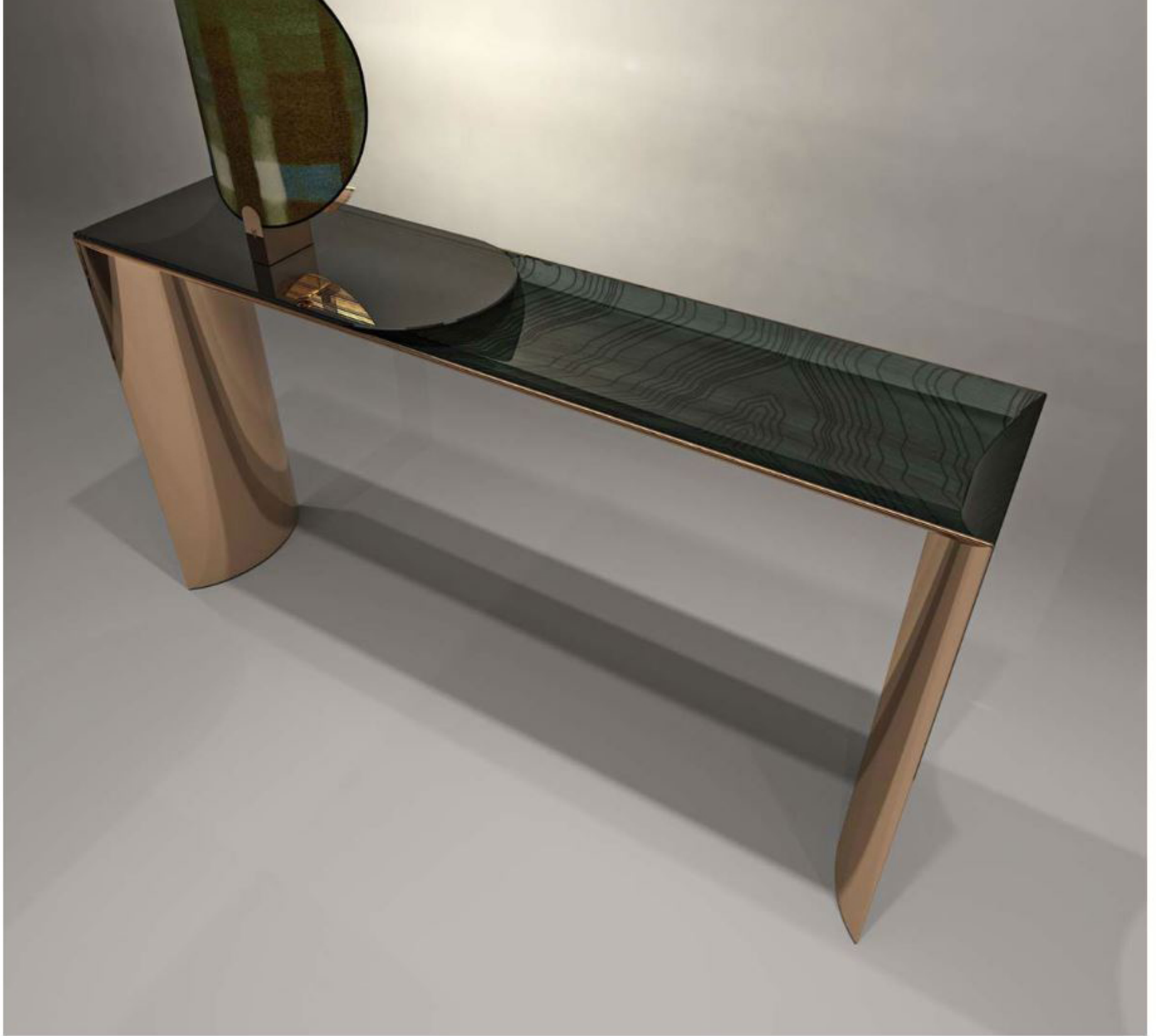
Стол Ekos, Respiro, Visionnaire

Casa Ricca: Сейчас luxury-дизайн ориентирован на устойчивость и экологичность, что приближает его к, так скажем, общему дизайну и современной архитектуре. Помните ли вы прецедент, когда люксовый дизайн был на одной линии с общим дизайном и архитектурой?