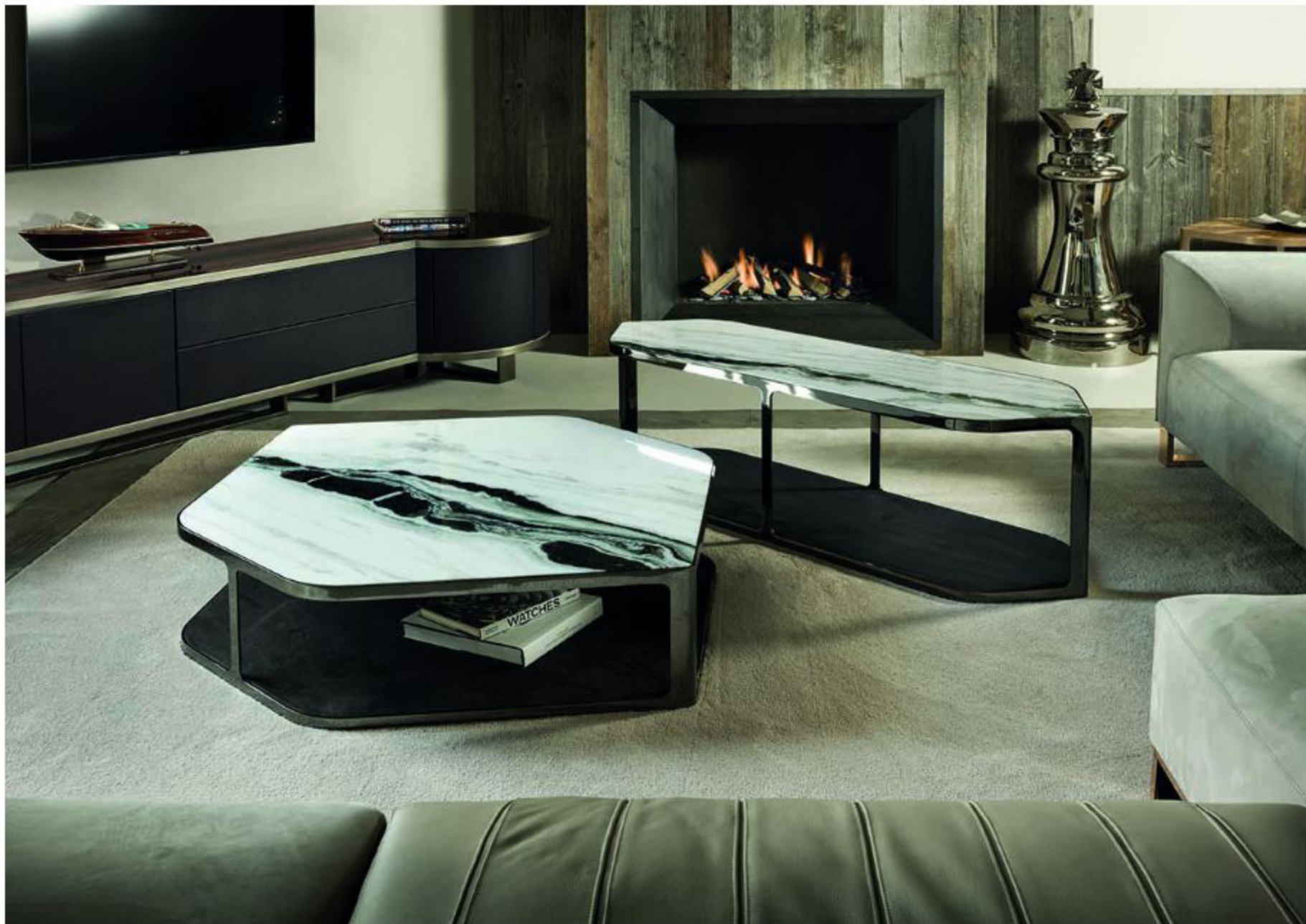
Стол Tiles, Longhi

Casa Ricca: Что вы думаете о Salone del Mobile, что нового было в этот раз, какие изменения в сфере luxury-дизайна произойдут после выставки?