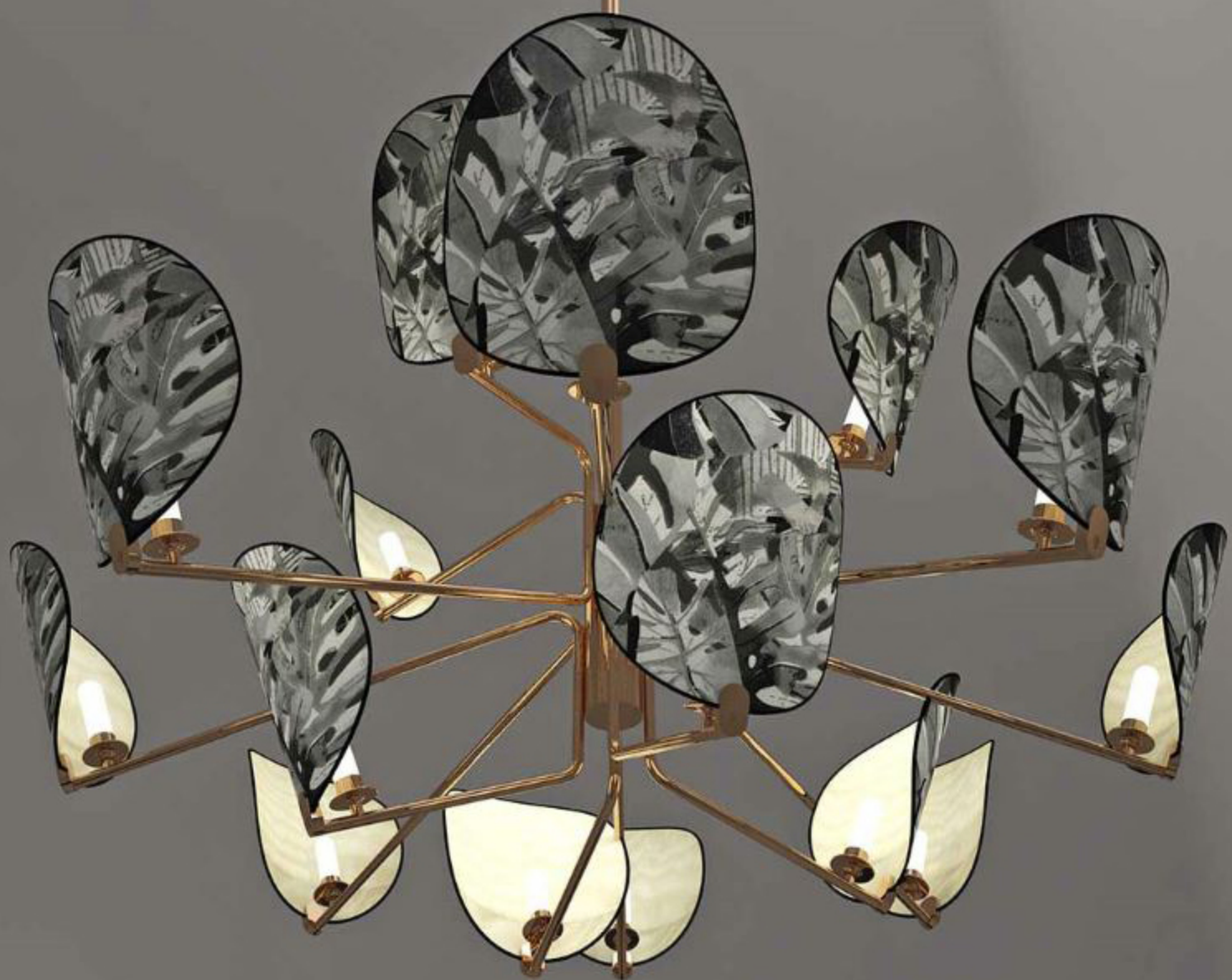
Люстра Akira, Respiro, Visionnaire