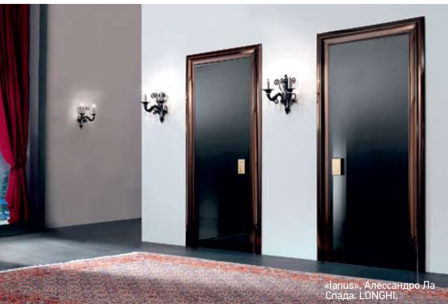
«Ianus», Алессандро Ла Спада. LONGHI.